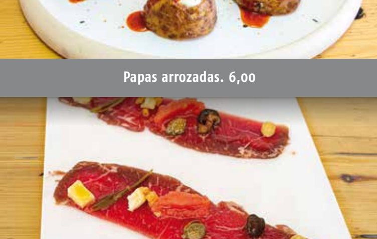
Cecina de Rubia Gallega. 7,00