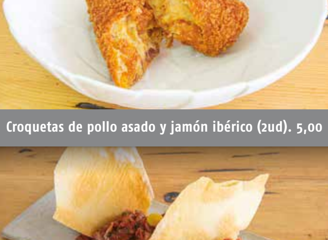
Croquetas de pollo asado y jamón ibérico (2ud). 5,00