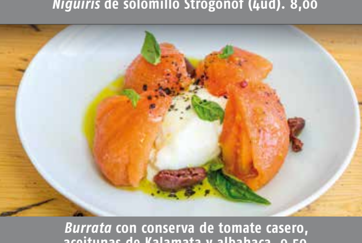
Niguiris de solomillo Strogonof (4ud). 8,00