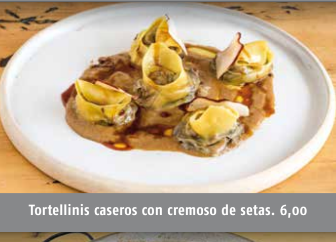
Carpaccio de gamba de Menorca con pesto de albahaca y piñones. 12,00